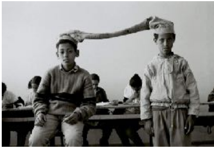
The Classroom (Serie) – Impresión en gelatina de plata blanco y negro, 50 x 60 cm

sus alumnos establecen relaciones de poder entre el individuo y la institución cuestionando las actitudes de los espectadores hacia su propio placer o incomodidad al ver estas escenas ambiguas.