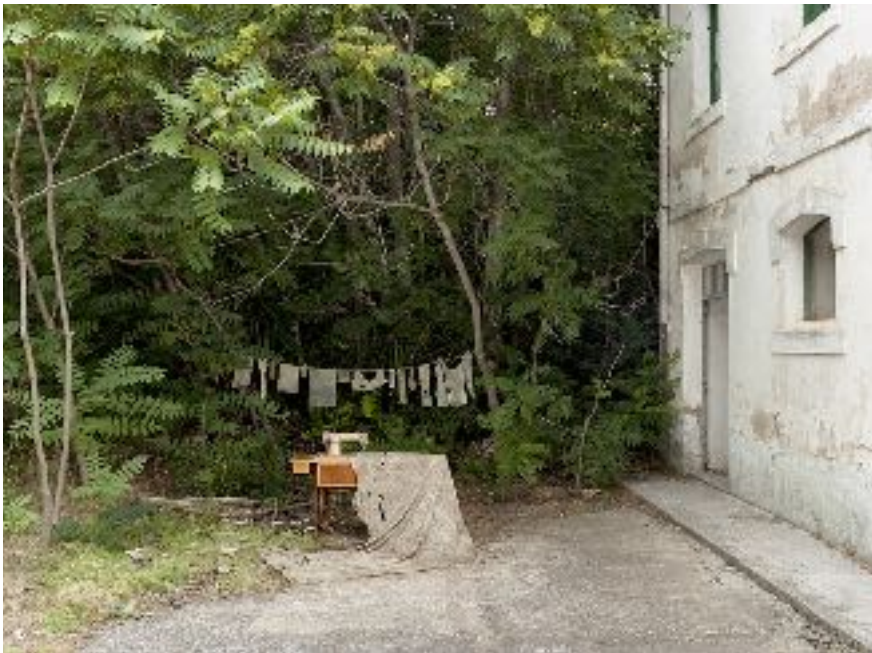
La piel entre costuras - Inkjet sobre papel Hahmemüle montado sobre dibond, metacrilato y marco