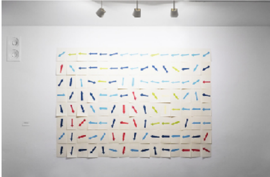
Windfinder - Aerosol sobre papel, 225 cm x 168 cm