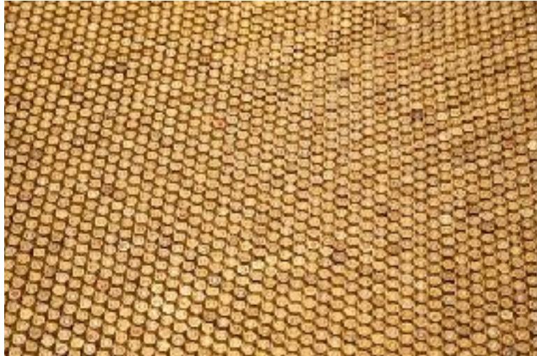
Mapas – Casquillos de bala

Galería Souvenir, un refugio del viento en el papel.